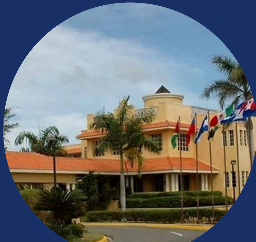
Ministerio de Relaciones Exteriores (MIREX)