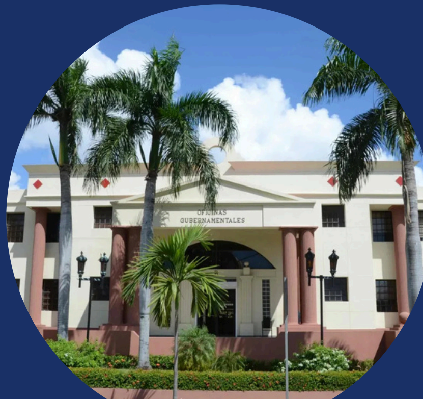
Ministerio de la Presidencia