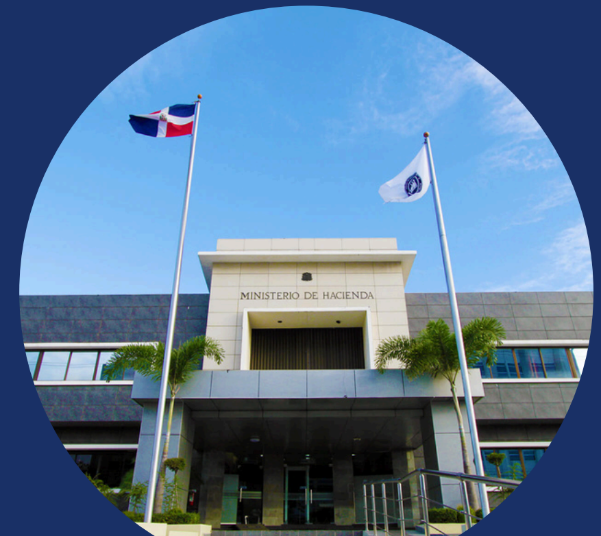
Ministerio de Hacienda y Economía