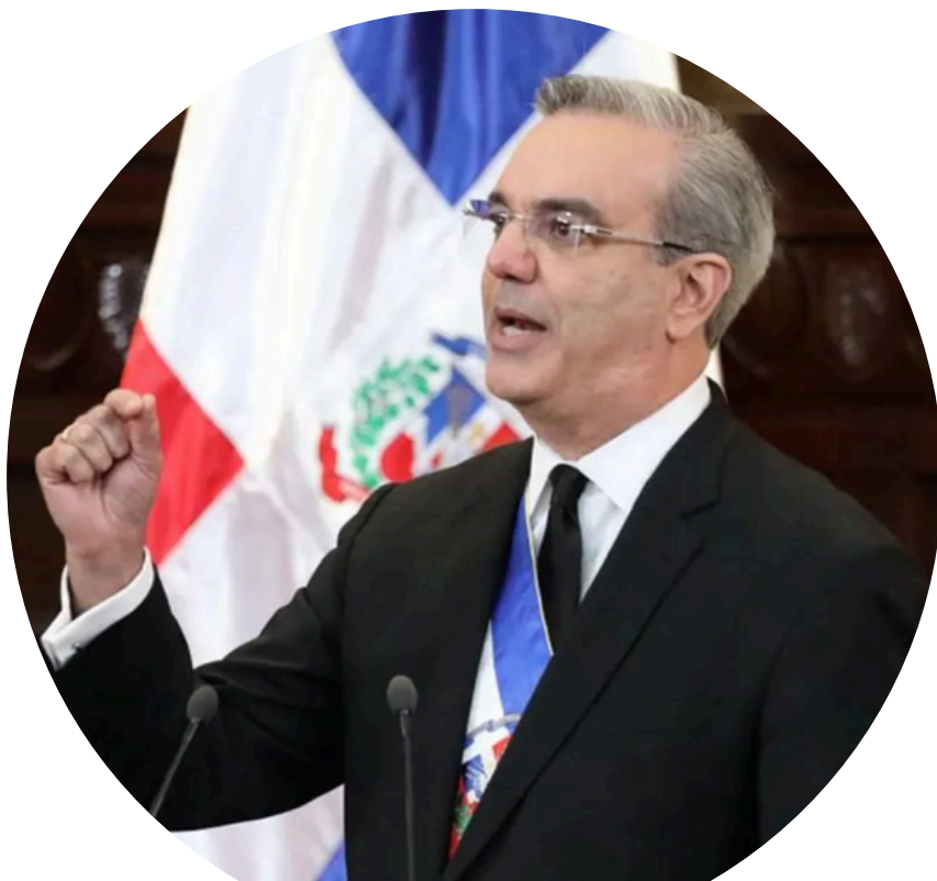
Luis Abinader Presidente de República Dominicana

El Presidente establece las prioridades y lineamientos de la política exterior del país y el Ministro de Relaciones Exteriores es responsable de su ejecución ♦