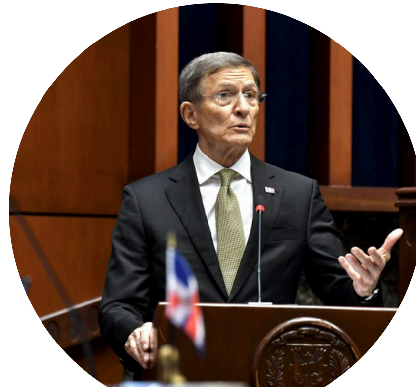
Roberto Alvarez Ministro de Relaciones