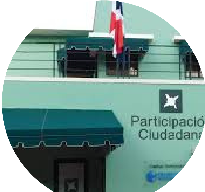
Organización de la Sociedad Civil