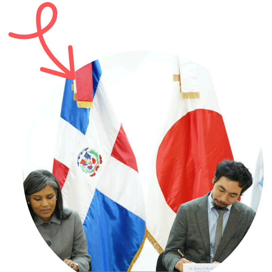
Agencias de Cooperación Internacional