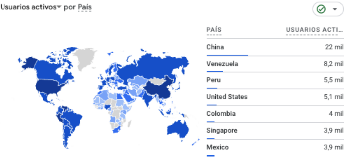
GRÁFICO 3. Usuarios activos de la web, por país.