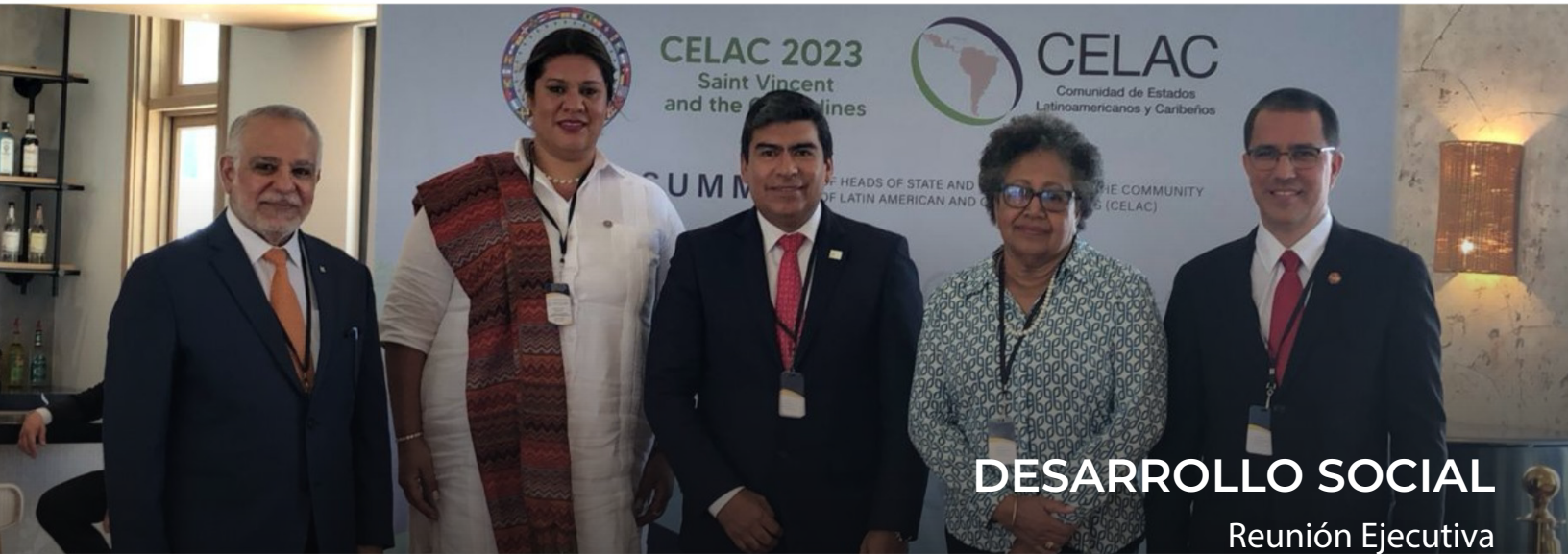
DESARROLLO SOCIAL Reunión Ejecutiva Kingstown, San Vicente y las Granadinas 1 de marzo de 2024 SP/REI-DSVG/IR-24