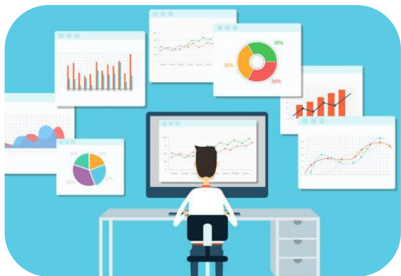
Estatística, Estudos e Meio Ambiente