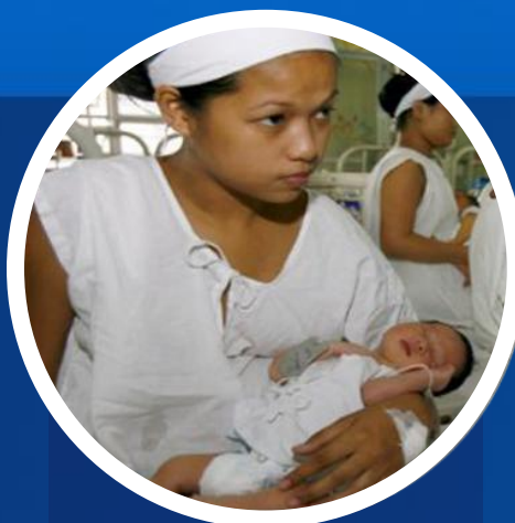
Salud materno infantil