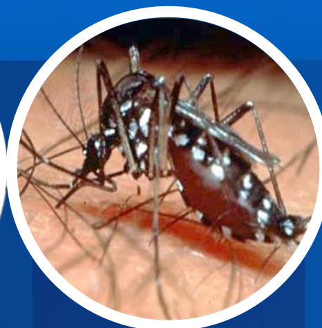
Malaria y Dengue