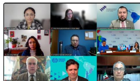
Participantes en la Tercera Edición de los Diálogos de alto nivel hacia una visión global de la seguridad social.