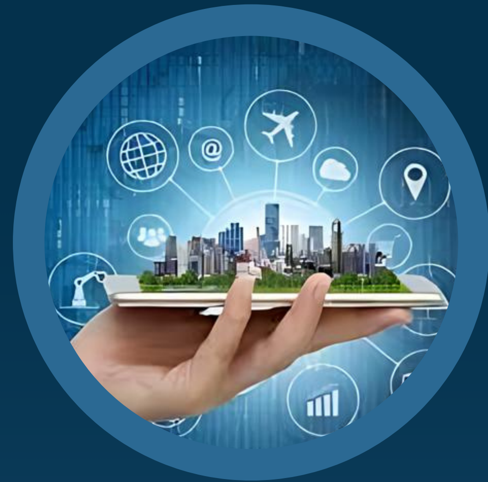
Destino Turístico Inteligente