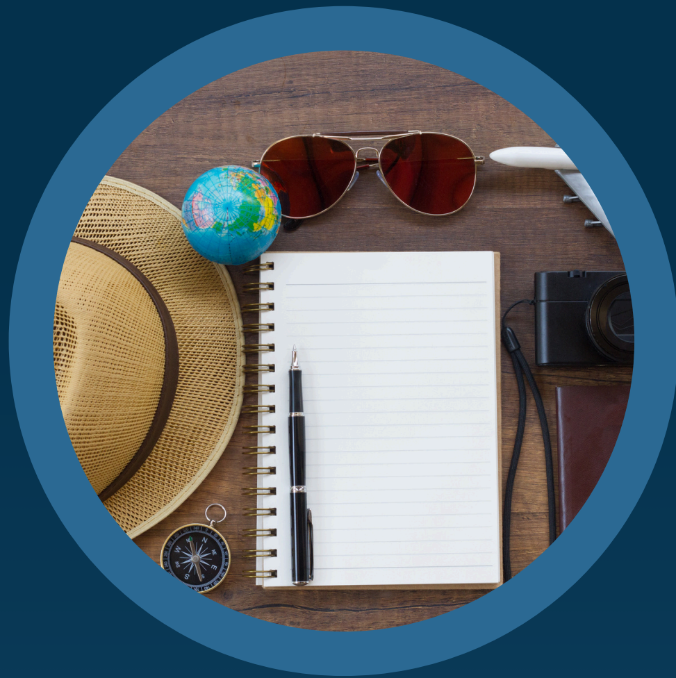
Destino Turístico "Tradicional"