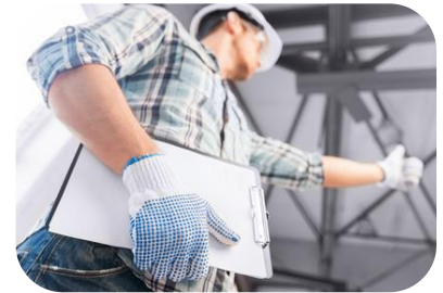
Desde la perspectiva de la Infraestructura Crítica y los Servicios Básicos