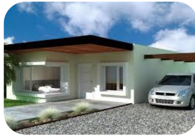
Desde la perspectiva Vivienda