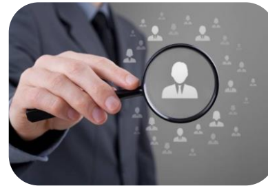
Desde la perspectiva de la Transparencia y Rendición de Cuentas