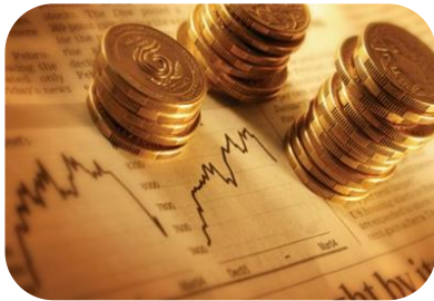
Desde la perspectiva Financiera

Como un tema transversal, la RRD se define como un proceso de enfoque interdisciplinario y de articulación multisectorial y multi-nivel que suma las habilidades, conocimiento y recursos de los actores en la planificación del desarrollo. A través de medidas estructurales o no estructurales, la RRD y las APPs adquieren un carácter transversal con el propósito de encontrar soluciones puntuales a problemas comunes bajo un esquema en el que todos los intereses están siendo atendidos con ganancias y beneficios esperados para todos los actores involucrados.